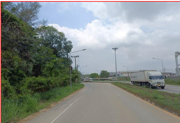
กม.ที่ ๖+๓๐๐ LT