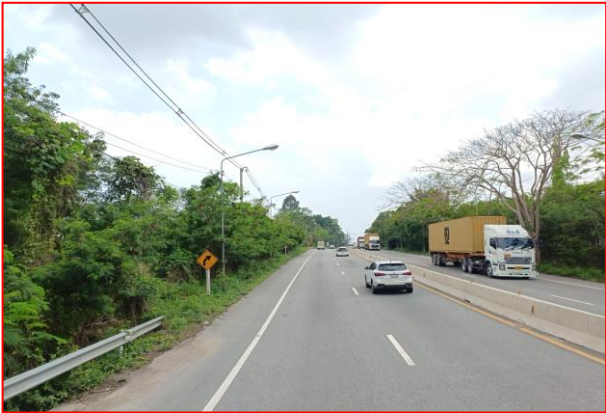
กม.ที่ ๓+๙๐๐ LT