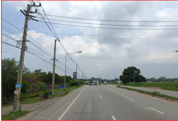
กม.ที่ ๕+๓๐๐ LT