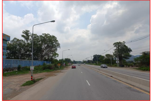
กม.ที่ ๕+๐๐๐ RT