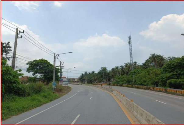
กม.ที่ ๖+๘๐๐ LT