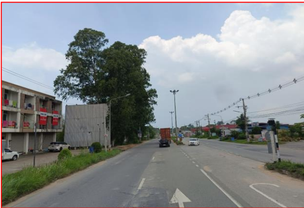
กม.ที่ ๗+๒๐๐ LT