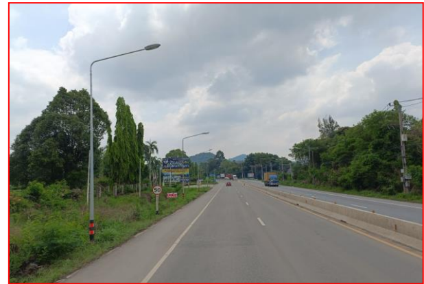
กม.ที่ ๔+๓๐๐ RT