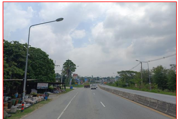
กม.ที่ ๖+๑๐๐ RT