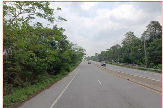
กม.ที่ ๓+๙๐๐ RT