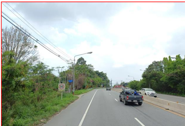
กม.ที่ ๔+๐๐๐ LT