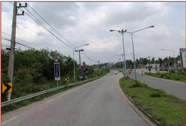
กม.ที่ ๕+๗๐๐ LT