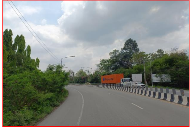
กม.ที่ ๔+๑๐๐ RT