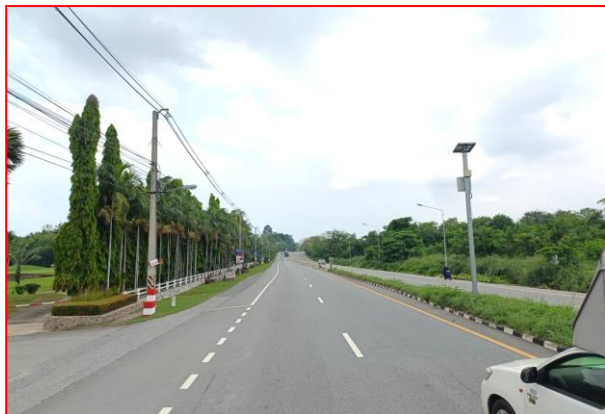
กม.ที่ ๓+๗๐๐ LT