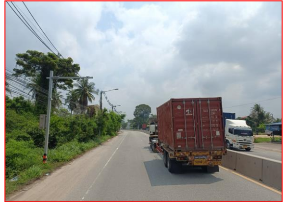
กม.ที่ ๘+๐๐๐ RT