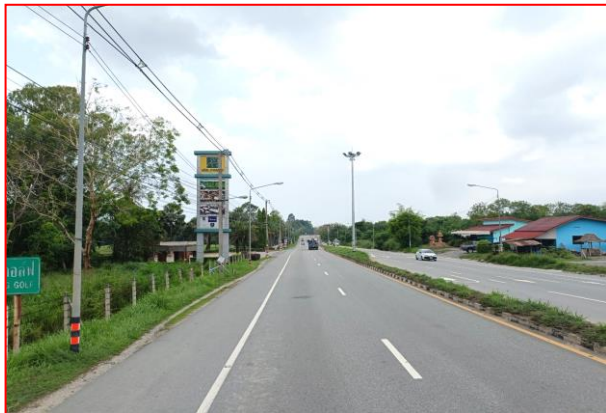
กม.ที่ ๓+๖๐๐ LT