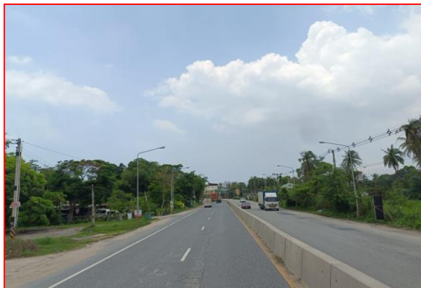
กม.ที่ ๗+๖๐๐ LT