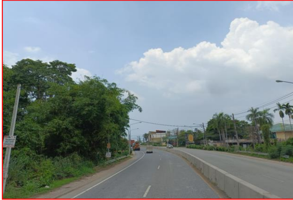
กม.ที่ ๗+๗๐๐ LT