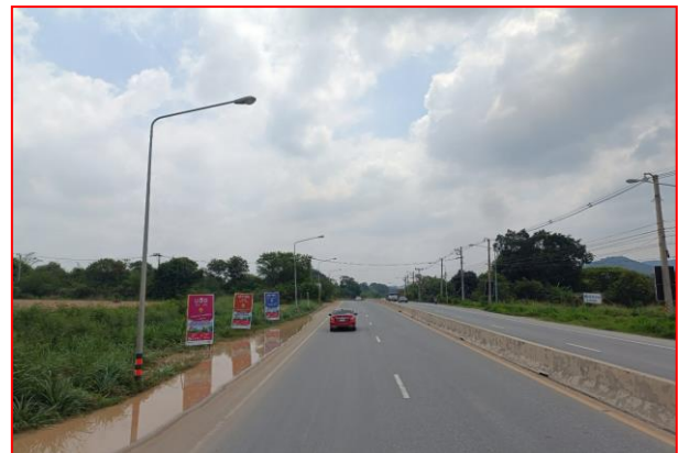
กม.ที่ ๔+๙๐๐ RT