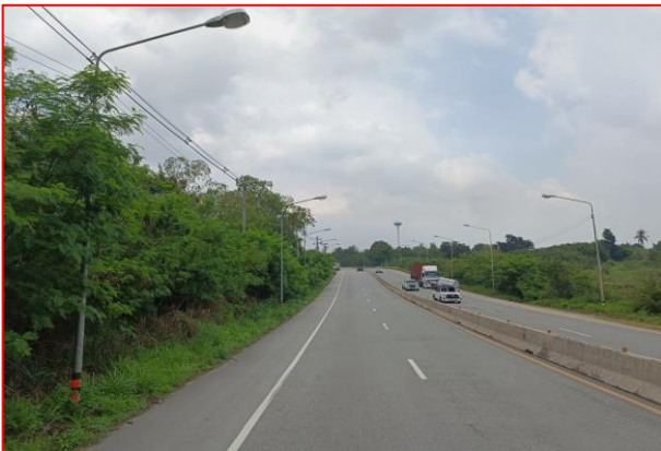
กม.ที่ ๔+๕๐๐ LT