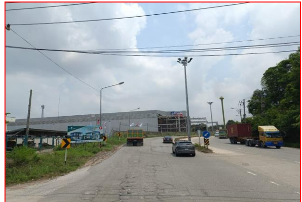
กม.ที่ ๖+๔๐๐ RT