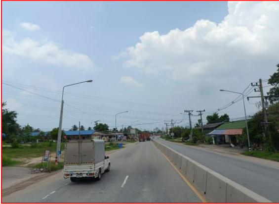
กม.ที่ ๘+๐๐๐ LT