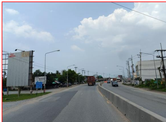
กม.ที่ ๘+๒๐๐ LT