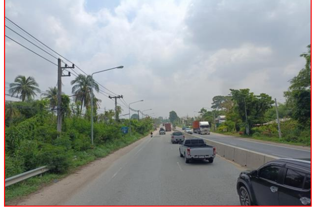
กม.ที่ ๗+๗๐๐ RT