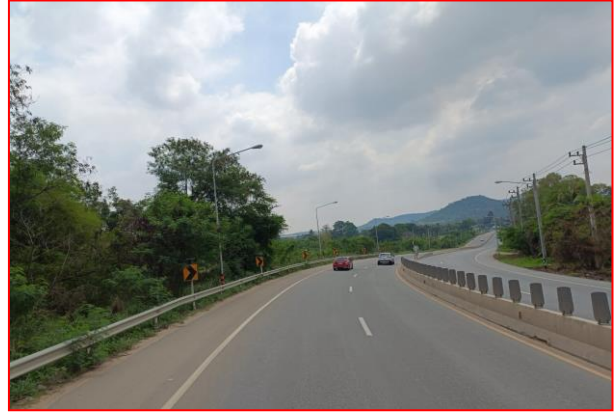
กม.ที่ ๔+๗๐๐ RT