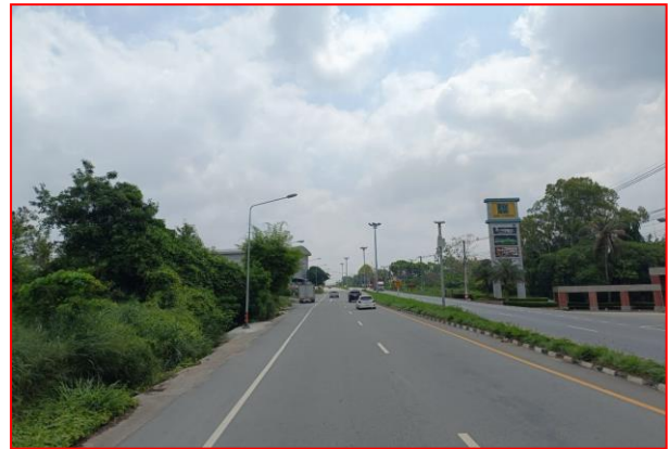
กม.ที่ ๓+๗๐๐ RT