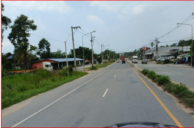
กม.ที่ ๗+๔๐๐ LT