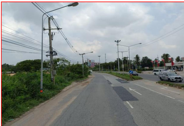
กม.ที่ ๕+๘๐๐ LT