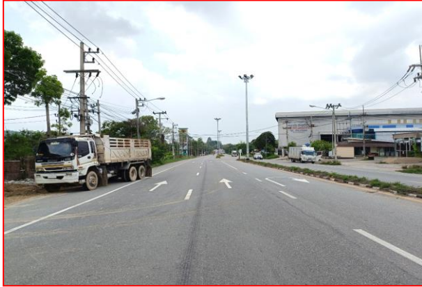
กม.ที่ ๓+๕๐๐ LT (จุดเริ่มต้นโครงการฯ)