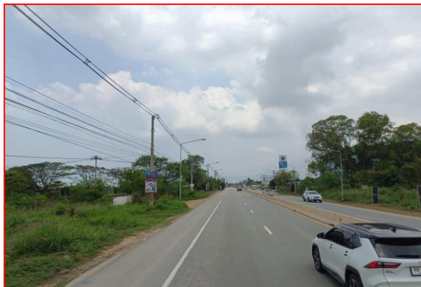
กม.ที่ ๔+๙๐๐ LT