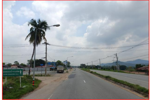
กม.ที่ ๕+๓๐๐ RT