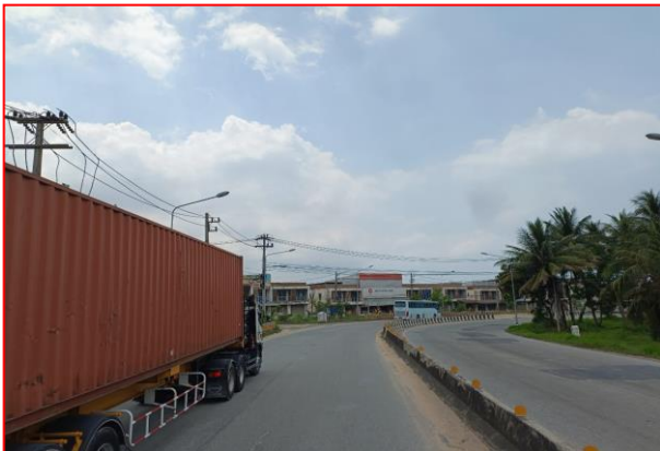
กม.ที่ ๖+๙๐๐ LT