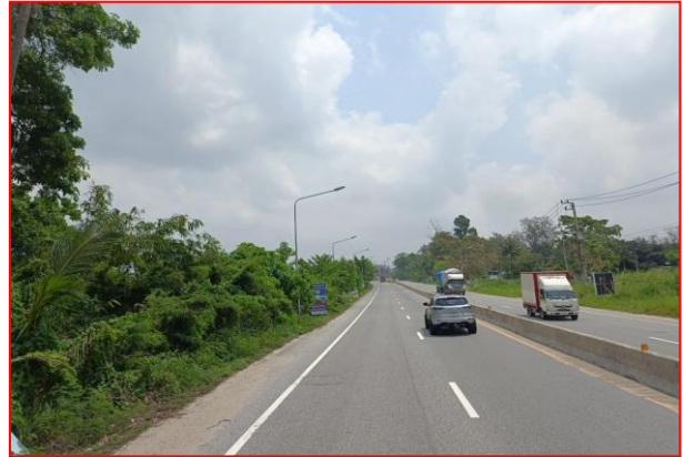
กม.ที่ ๖+๘๐๐ RT