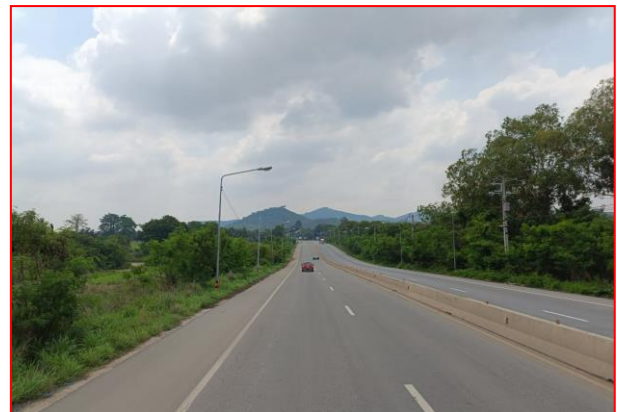
กม.ที่ ๔+๖๐๐ RT