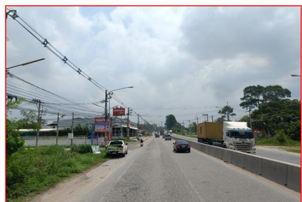
กม.ที่ ๗+๖๐๐ RT