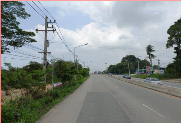
กม.ที่ ๖+๐๐๐ LT