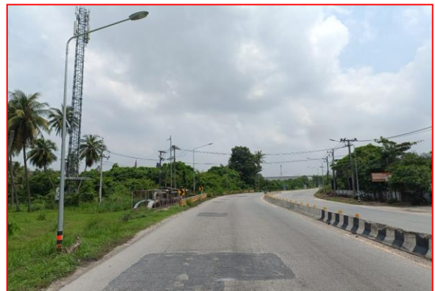
กม.ที่ ๖+๙๐๐ RT