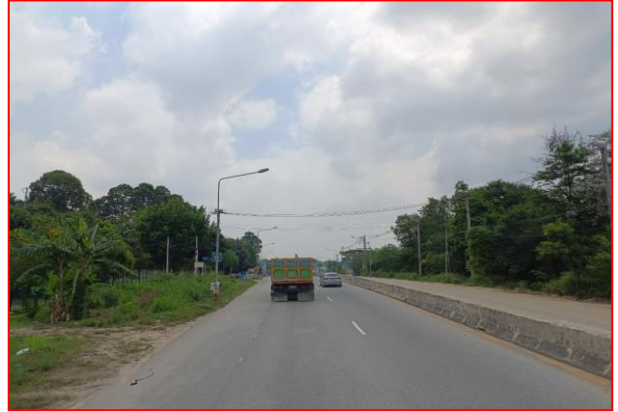
กม.ที่ ๖+๒๐๐ RT