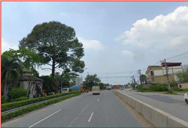
กม.ที่ ๗+๘๐๐ LT