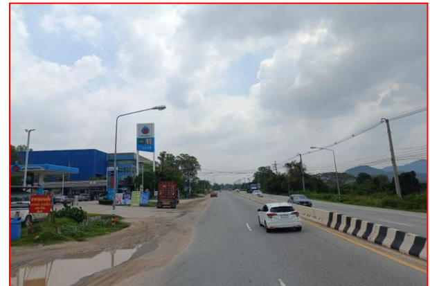
กม.ที่ ๕+๑๐๐ RT