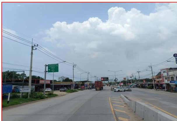
กม.ที่ ๘+๓๑๗.๖๐๑ LT (จุดสิ้นสุดโครงการฯ)