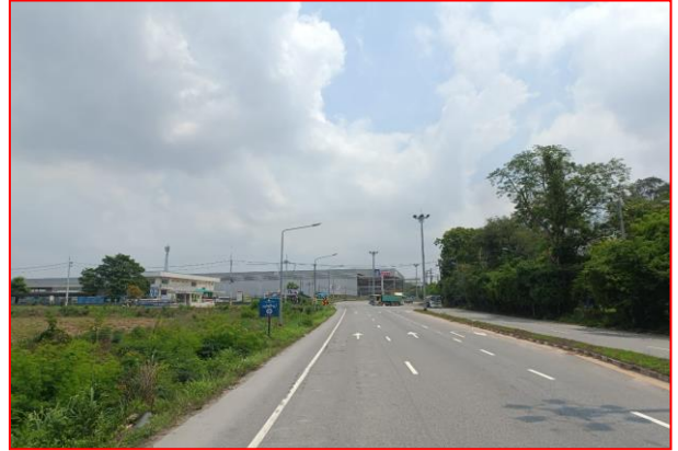
กม.ที่ ๖+๕๐๐ RT