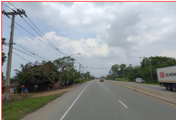
กม.ที่ ๔+๘๐๐ LT