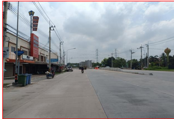
กม.ที่ ๘+๓๑๗.๖๐๑ RT (จุดสิ้นสุดโครงการฯ)