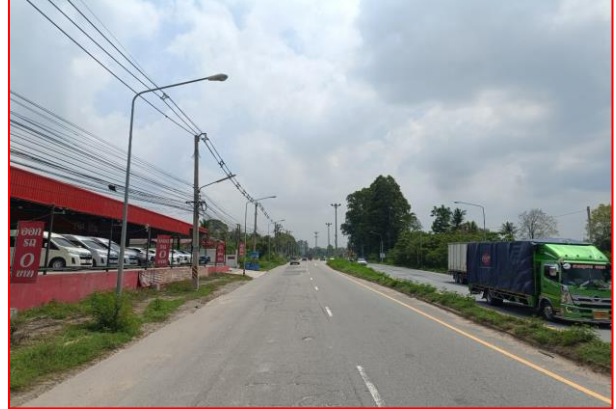
กม.ที่ ๗+๔๐๐ RT