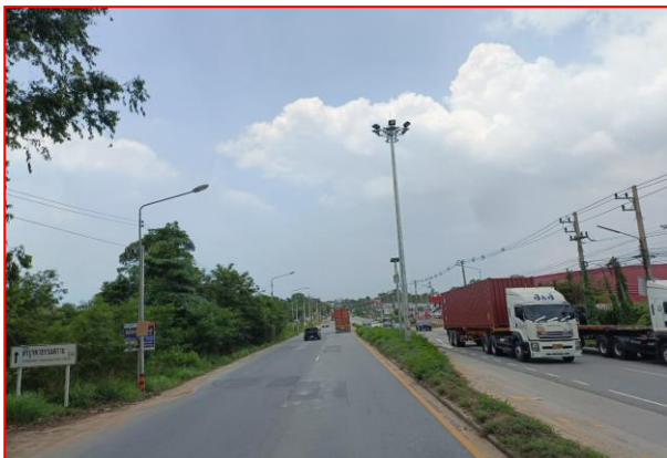
กม.ที่ ๗+๓๐๐ LT