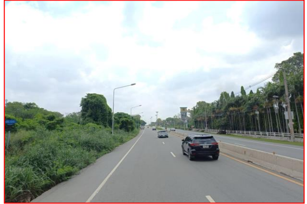
กม.ที่ ๓+๘๐๐ RT