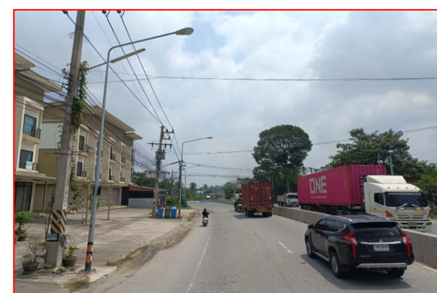
กม.ที่ ๗+๙๐๐ RT