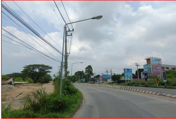
กม.ที่ ๕+๙๐๐ LT