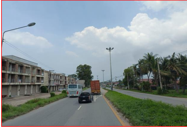
กม.ที่ ๗+๑๐๐ LT