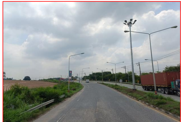
กม.ที่ ๕+๗๐๐ RT