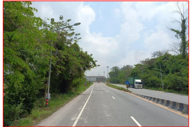
กม.ที่ ๖+๖๐๐ RT