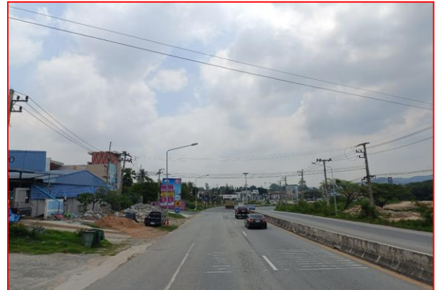
กม.ที่ ๖+๐๐๐ RT