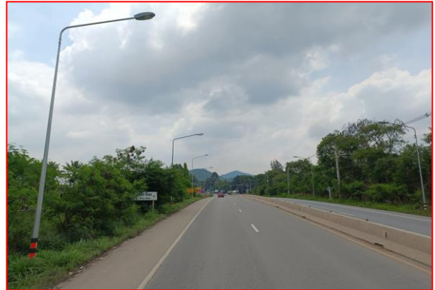
กม.ที่ ๔+๔๐๐ RT