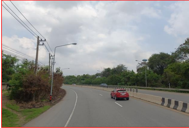
กม.ที่ ๔+๗๐๐ LT