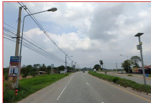
กม.ที่ ๕+๒๐๐ LT