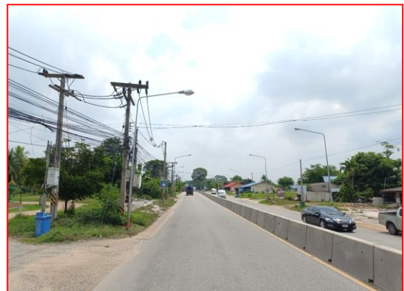
กม.ที่ ๘+๑๐๐ RT