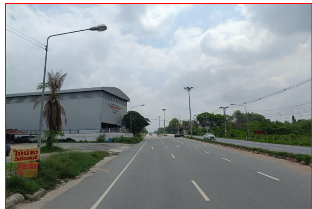
กม.ที่ ๓+๖๐๐ RT