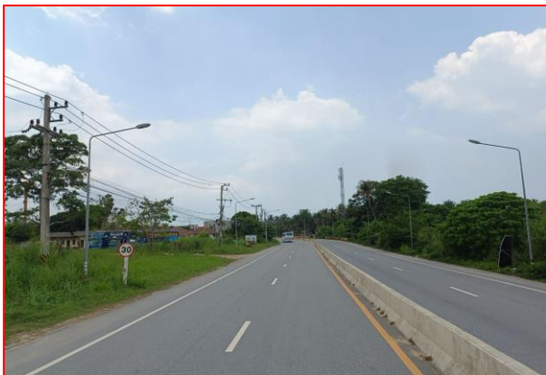
กม.ที่ ๖+๗๐๐ LT