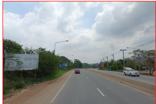
กม.ที่ ๔+๘๐๐ RT