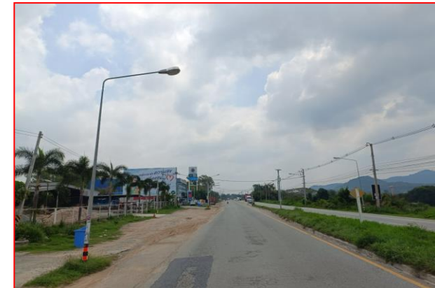
กม.ที่ ๕+๒๐๐ RT