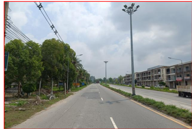
กม.ที่ ๗+๒๐๐ RT