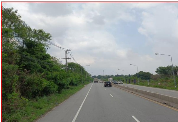
กม.ที่ ๔+๓๐๐ LT