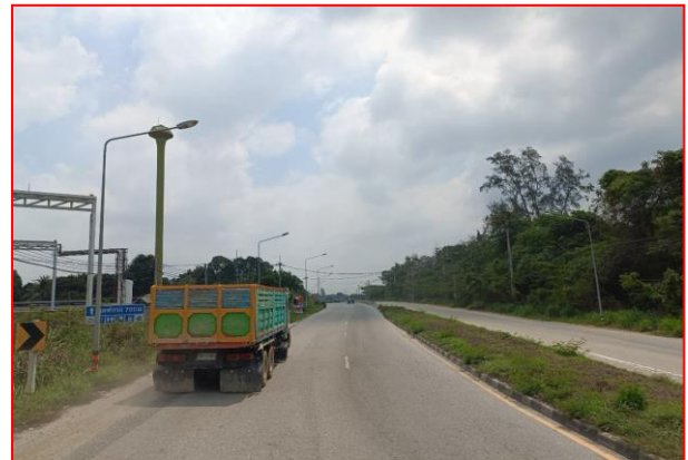
กม.ที่ ๖+๓๐๐ RT