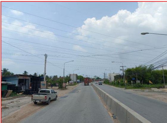
กม.ที่ ๘+๑๐๐ LT