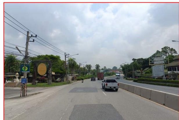
กม.ที่ ๗+๘๐๐ RT