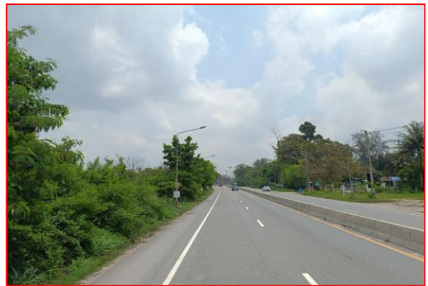
กม.ที่ ๖+๗๐๐ RT