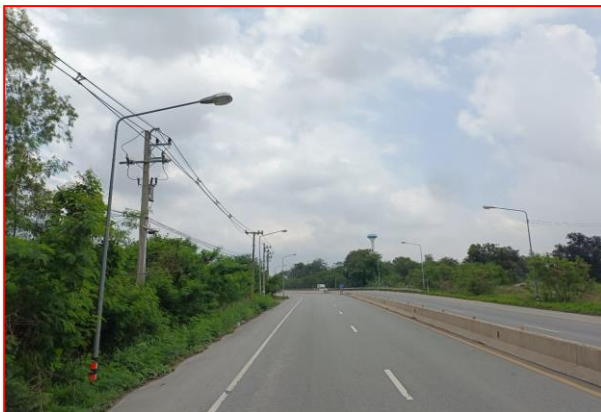
กม.ที่ ๔+๖๐๐ LT