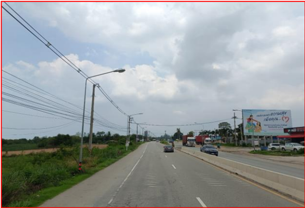
กม.ที่ ๕+๑๐๐ LT