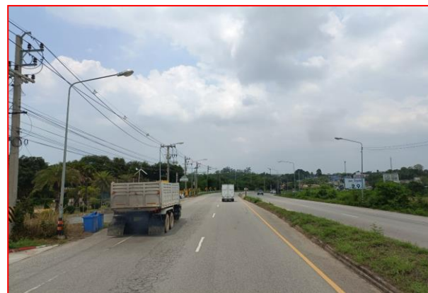
กม.ที่ ๕+๕๐๐ LT