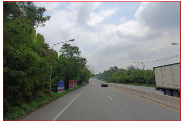
กม.ที่ ๔+๐๐๐ RT