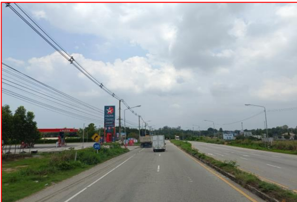
กม.ที่ ๕+๔๐๐ LT