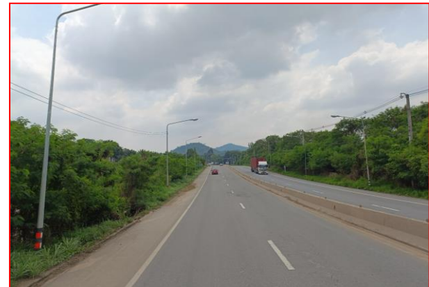
กม.ที่ ๔+๕๐๐ RT