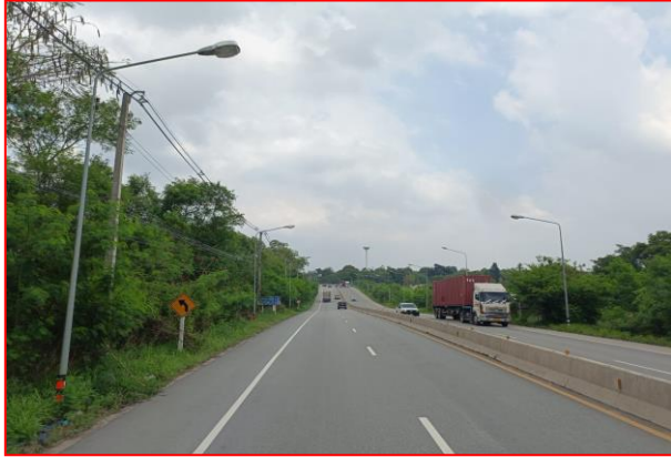
กม.ที่ ๔+๔๐๐ LT