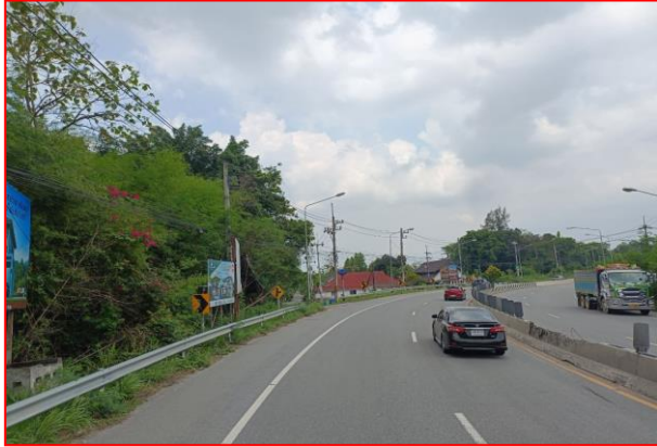
กม.ที่ ๔+๑๐๐ LT