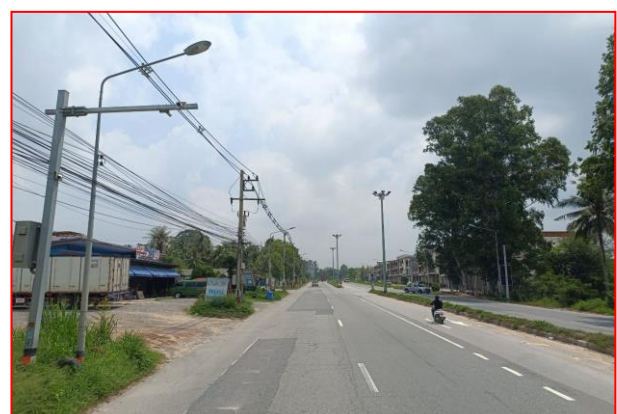
กม.ที่ ๗+๓๐๐ RT