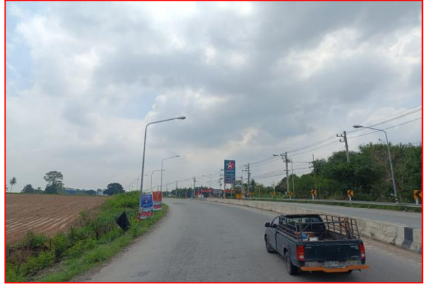
กม.ที่ ๕+๖๐๐ RT