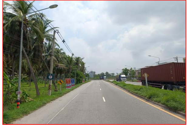
กม.ที่ ๗+๑๐๐ RT