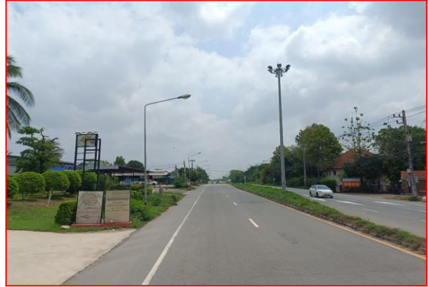
กม.ที่ ๓+๕๐๐ RT (จุดเริ่มต้นโครงการฯ)