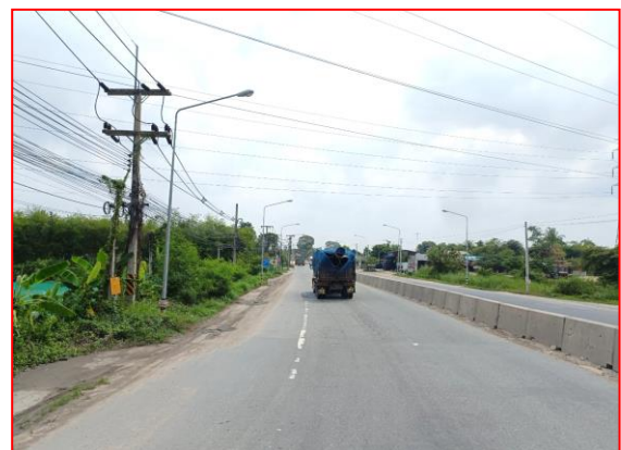
กม.ที่ ๘+๒๐๐ RT