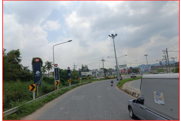
กม.ที่ ๕+๙๐๐ RT