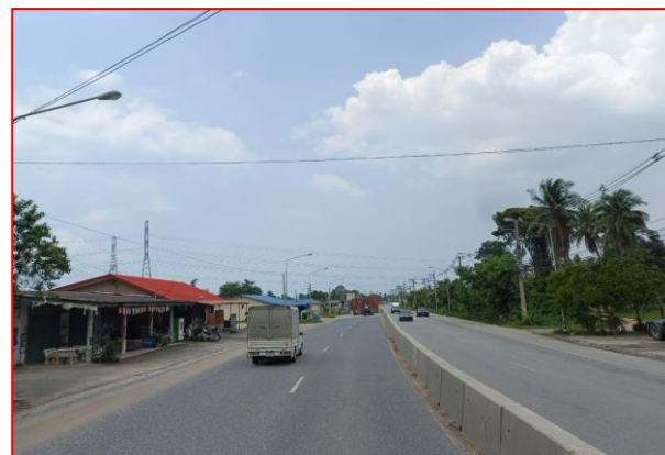
กม.ที่ ๗+๙๐๐ LT