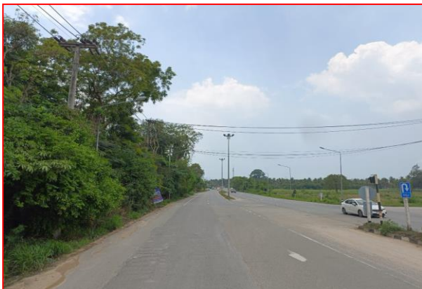
กม.ที่ ๖+๔๐๐ LT