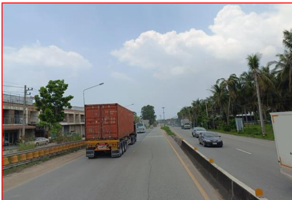
กม.ที่ ๗+๐๐๐ LT