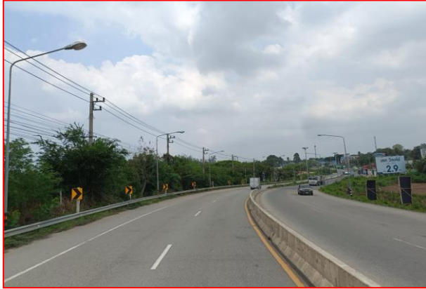
กม.ที่ ๕+๖๐๐ LT