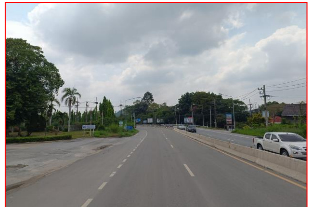
กม.ที่ ๔+๒๐๐ RT