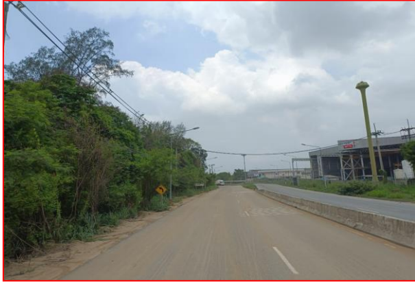
กม.ที่ ๖+๒๐๐ LT