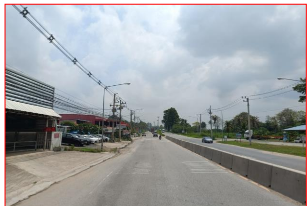
กม.ที่ ๗+๕๐๐ RT