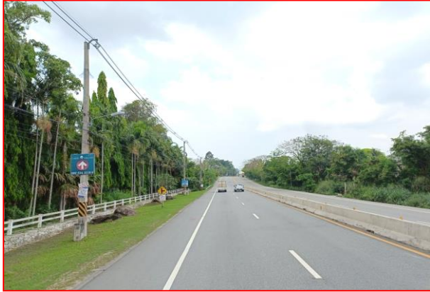
กม.ที่ ๓+๘๐๐ LT