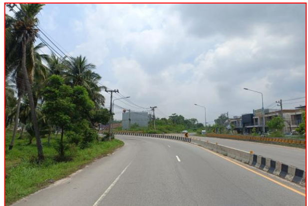
กม.ที่ ๗+๐๐๐ RT