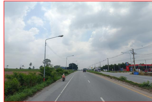
กม.ที่ ๕+๕๐๐ RT