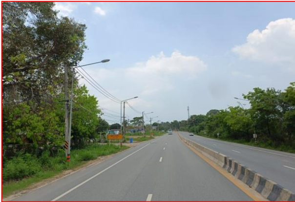
กม.ที่ ๖+๖๐๐ LT