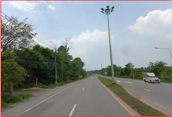
กม.ที่ ๖+๕๐๐ LT