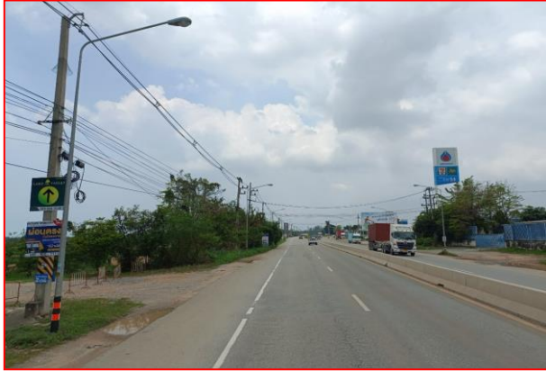
กม.ที่ ๕+๐๐๐ LT