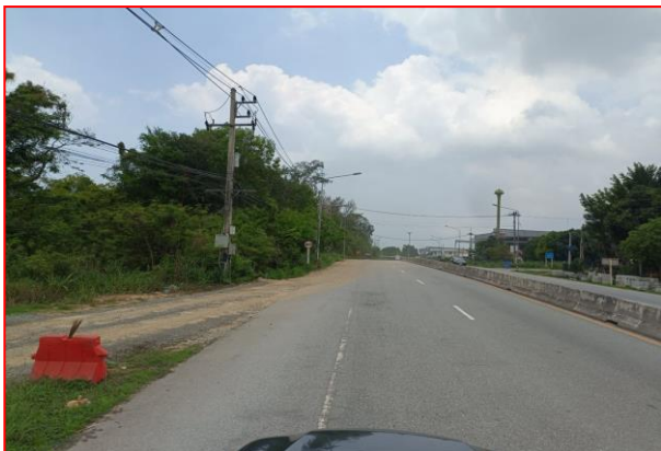
กม.ที่ ๖+๑๐๐ LT