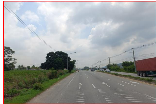
กม.ที่ ๕+๔๐๐ RT