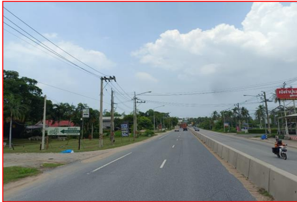
กม.ที่ ๗+๕๐๐ LT